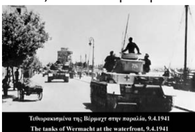
Τεθωρακισμένα της Βέρμαχτ στην παραλία, 9.4.1941 The tanks of Wehrmacht at the waterfront, 9.4.1941

Στις 9/4/1941 έγινε η είσοδος των γερμανών στην