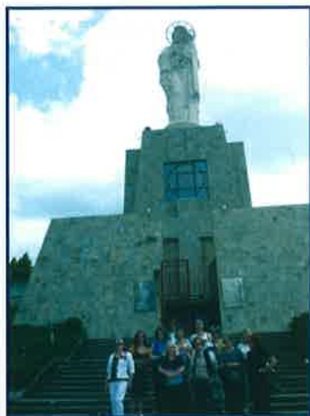
έξω από την εκκλησία της προστάτιδας του Χάσκοβο Παναγίας.

Όταν τον Φεβρουάριο ο Σύνδεσμος των Θεσσαλονικέων πραγματοποίησε την μεγάλη εκδήλωσή του την αφιερωμένη στις πόλεις της Ευρώπης που έχουν αδελφοποιηθεί με την Θεσσαλονίκη μας η Φιλιπούπολη (PLOVDIV) της Βουλγαρίας (μία από τις...παλαιότερες αδελφές μας) μας έστειλε πολυμελή αντιπροσωπεία που αποτελείτο από δημάρχους και υψηλούς αξιωματούχους του Δήμου, οι οποίοι και μας προσκάλεσαν στην πόλη τους.