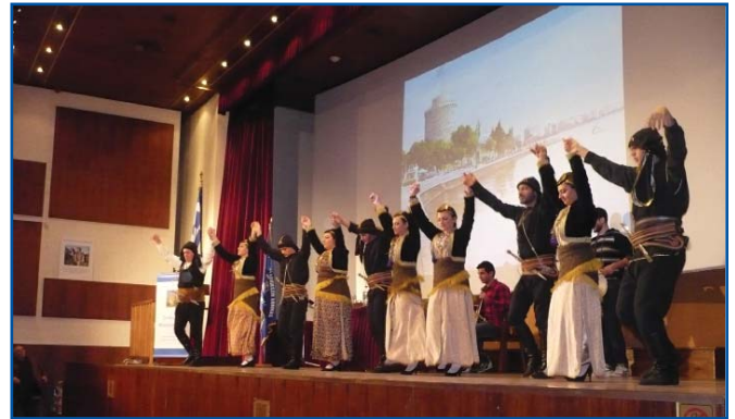
Το χορευτικό τμήμα του Παμποντιακού Συλλόγου «ΑΡΓΩ» σε ποντιακούς χορούς