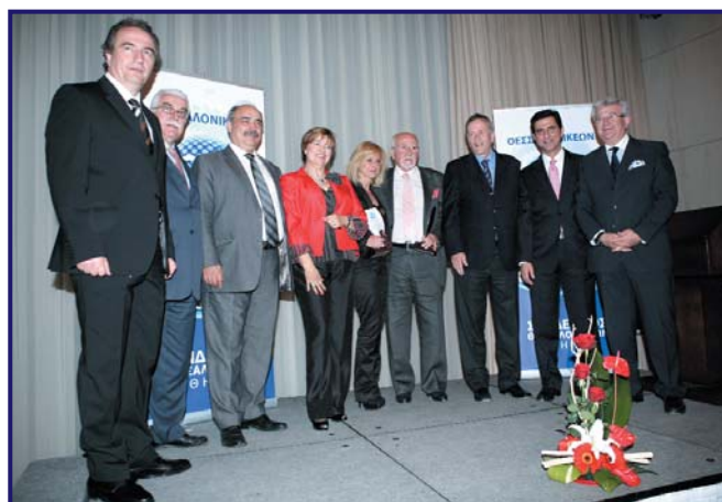
Από την εκδήλωση του 2010

Το Δ.Σ. ανακοινώνει στα μέλη και τους φίλους του Συνδέσμου μας ότι βρίσκεται στην ευχάριστη θέση να ανακοινώσει ότι την φετινή εκδήλωση - που προβλέπεται ότι θα αποτελέσει σταθμό στα δρώμενα του Συνδέσμου μας - θα παρουσιάσει η έγκριτη Δημοσιογράφος, Σύμβουλος έκδοσης της εφημερίδας «ΜΑΚΕΔΟΝΙΑ» και Γενική Διευθύντρια του Ινστιτούτου Δημοκρατίας «ΚΩΝΣΤΑΝΤΙΝΟΣ ΚΑΡΑΜΑΝΛΗΣ» κα