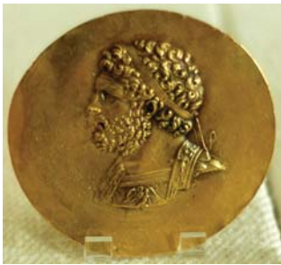
Φίλιππος ο Β΄ (Χρυσό μετάλλιο)

Η μέγιστη προσωπικότητα και δράση, και τα τεράστια επιτεύγματα του Γιου του Μεγάλου Αλεξάνδρου, επισκιάζουν την επίσης μεγάλη προσωπικότητα και τα επιτεύγματα του Πατέρα Φιλίππου Β΄, ο οποίος δικαίως εντάσσεται στους κορυφαίους βασιλείς της Δυναστείας των Αργεαδών. Ο πρώτος βασιλέας αυτής ήταν, κατά την Ελληνική Μυθολογία, ο Κάρανος (βασ. 808–778 π.Χ.), αλλά ο ιδρυτής του Μακεδονικού Κράτους υπήρξε ο Περδίκκας Α΄ (βασ. 700–676 π.Χ.). (Οι Αργεάδες ισχυρίζονται πως κατάγονται από τους Τημενίδες του Άργους, στην Πελοπόννησο, όπου ο θρυλικός τους πρόγονος ήταν ο Τήμενος, ο τρισέγγονος του Ηρακλή.)