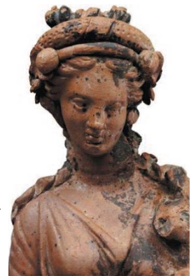
Πήλινο ειδώλιο από το Ανατολικό νεκροταφείο της Πέλλας

Αποτελεί επομένως μια από τις πρωιμότερες γραπτές μαρτυρίες που αποδεικνύουν ότι ήδη τον 4ο αιώνα π.Χ. ο πληθυσμός της Μακεδονίας ήταν ελληνόφωνος.