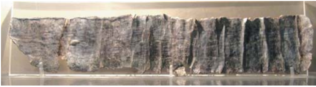
Το εύρημα: Ενεπίγραφο μολύβδινο έλασμα τυλιγμένο σε ρολό (κατάδεσμος) 4ος αι. π.Χ. μέγιστο σωζόμενο ύψος 28,4 εκατ., μέγιστο σωζόμενο πλάτος 5,7 εκατ. Νέο Αρχαιολ. Μουσείο Πέλλας

Όταν πέθανε ο Μάκρονας, η Φίλα βρήκε την ευκαιρία που ζητούσε. Είχε ήδη έτοιμο τον μολύβδινο κατάδεσμο, είχε γράψει εκεί αυτό που ειλικρινά επιθυμούσε, τον είχε τυλίξει προσεκτικά και σφιχτά σε ρολό. Ο Μάκρων που έφευγε πιά για τον Κάτω Κόσμο θα μετέφερε στους δαίμονες το μήνυμά της, την ικεσία της. Μόνον εκείνοι μπορούσαν πιά να την βοηθήσουν.