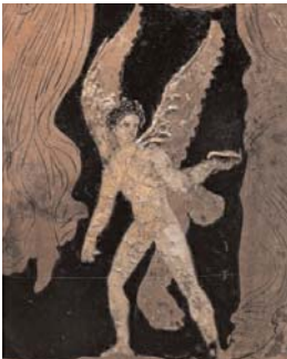
Έρωτας σε ερυθρόμορφη πελίκη του Ανατολικού νεκροταφείου της Πέλλας

Στην Πέλλα ήταν ήδη απομονωμένη, εγκαταλειμμένη από φίλους και γνωστούς. Περιφρονημένη από όλους και κυρίως από τον ... Διονυσοφώντα που ετοιμαζόταν να παντρευτεί την Θετίμα και σχεδίαζαν ήδη την τελετή του